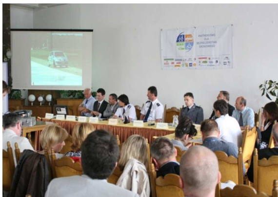
Uczestnicy II Forum BRD

Bazą do dyskusji było Rozporządzenie Ministra Infrastruktury z dnia 10 kwietnia 2008 r. w sprawie wymagań dotyczących prowadzenia ośrodka doskonalenia techniki jazdy, egzaminowania kandydatów na instruktorów techniki jazdy, postępowania z dokumentacją związaną z prowadzeniem szkoleń oraz wzorów stosowanych dokumentów Dz.U. Nr 77 poz. 458 . Rozporządzenie stanowi próbę implementacji założeń dyrektywy Nr 2003/59/WE wprowadzająca m.in. obowiązek dodatkowego szkolenia kierowców poprawiającego technikę jazdy.