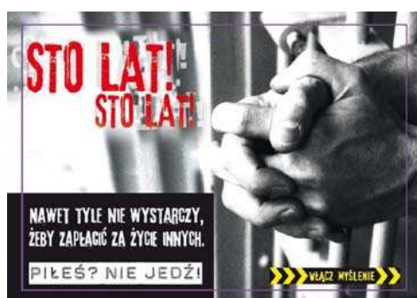
Kreacja kampanii. Materiał KRBRD

Olsztyński pilotażowy projekt “Piłeś? Nie jedź!” jest częścią międzynarodowej kampanii prowadzonej przez Global Road Safety Partnership. Partnerstwo dla Bezpieczeństwa Drogowego w Polsce, należące do GRSP, zaangażowało się w realizację tego projektu, udostępniając wiedzę i międzynarodowe doświadczenia GRSP.