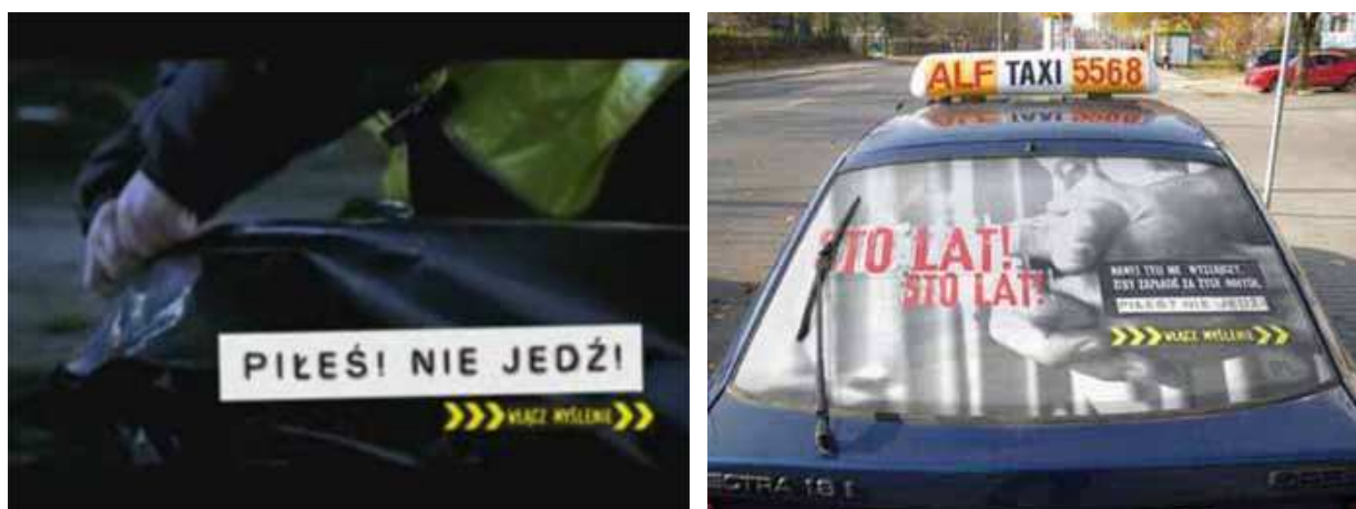
Kadr ze spotu kampanii. Materiał KRBRD, Taksówka biorąca udział w kampanii, Zdjęcie: K. Piskorz

W trakcie warsztatów opracowano założenia drugiego etapu projektu, na który składała się miesięczna kampania społeczno-informacyjna, programy społeczne oraz wzmożone kontrole trzeźwości prowadzone przez olsztyńską Policję. Hasło i kreacja przygotowanej kampanii zostały udostępnione przez Krajową Radę Bezpieczeństwa Ruchu Drogowego.