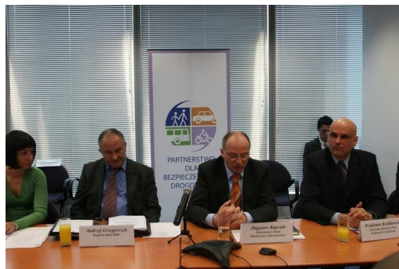
Uczestnicy spotkania, Zdjęcie: Bank Światowy