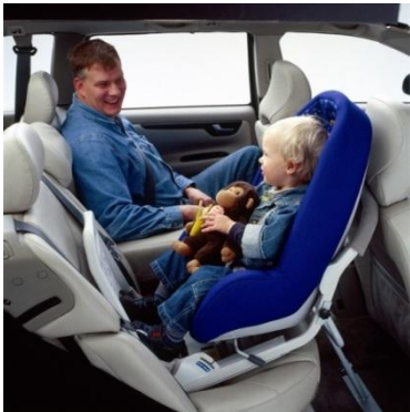
Rysunek 3: Fotelik VOLVO dla dzieci w wieku do 3-4 lat montowany tyłem do kierunku ruchu przy użyciu ISOFIX

Uformowane zostały specjalnie w celu rozłożenia sił na powierzchnię całych pleców. Powody użycia odwróconych fotelików dla dzieci w samochodach są dokładnie takie same. W przypadku kolizji polegającej na uderzeniu przodem samochodu w przeszkodę lub inny samochód całe plecy dziecka absorbują siłę uderzenia, a dużo bardziej podatna na uszkodzenia szyja pozostaje ochroniona. Dzięki profesorowi Aldmanowi odwrócone foteliki dla dzieci weszły do powszechnego użytku w Szwecji dużo wcześniej niż w innych krajach. Rezultaty widoczne są w statystykach wypadków. Badania przeprowadzane przez firmę ubezpieczeniową Folksam pokazują, że ryzyko śmierci lub poważnych obrażeń jest 5 razy większe w fotelikach ustawionych przodem do kierunku jazdy. Jeśli porównasz szwedzkie statystyki wypadków ze statystykami pochodzącymi z krajów, gdzie większość dzieci podróżuje siedząc przodem, różnice są uderzające!!! Przykładem może być Francja. Ryzyko śmierci dziecka w wypadku samochodowym (w przeliczeniu na 100 tys. mieszkańców) jest dwa razy większe niż w Szwecji. Niemieckie statystyki ujawniają podobną zależność. Szczególne, znaczące różnice zauważyć można u dzieci powyżej 1 roku życia. Większość niemieckich dzieci właśnie w tym wieku zaczyna używać fotelików mocowanych przodem, kiedy zaś większość szwedzkich dzieci używa fotelików odwróconych tyłem, co najmniej do swoich 3 urodzin.